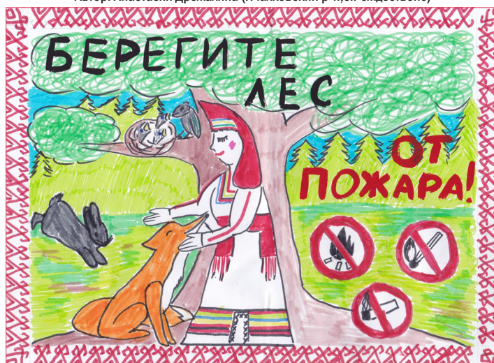
Автор: Анастасия Храмова (Лямбирский р-н, с.Александровка)