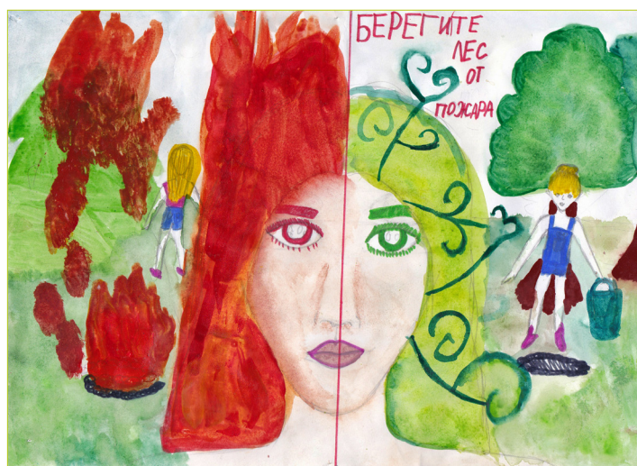
Автор: Анастасия Дрожалина (Ичалковский р-н, с.Рождествено)