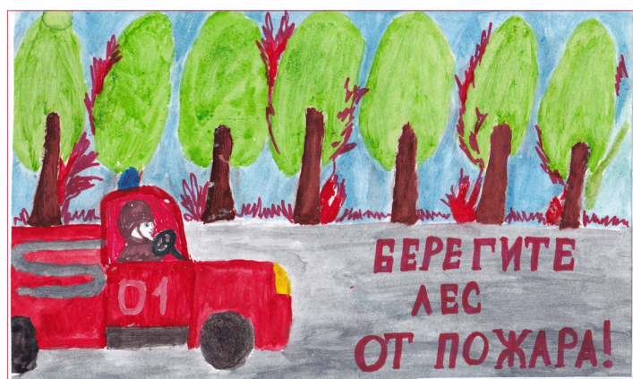
Автор: Кирилл Родионов (Ичалковский р-н, с.Оброчное)